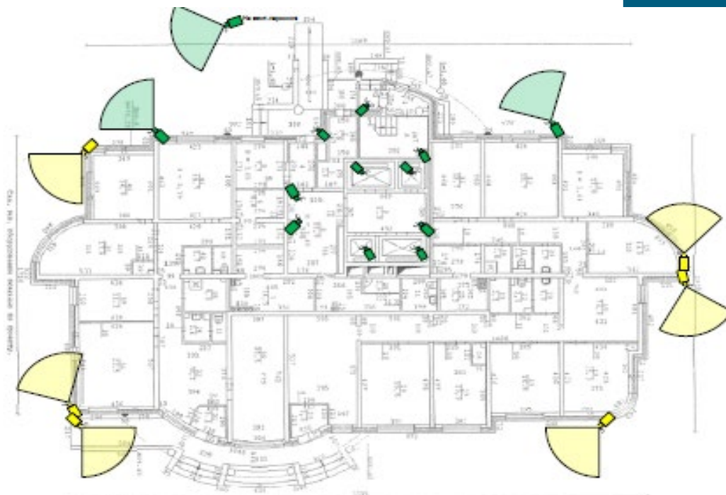
Схема установки видеокамер

(зеленый цвет – ранее установленные видеокамеры)